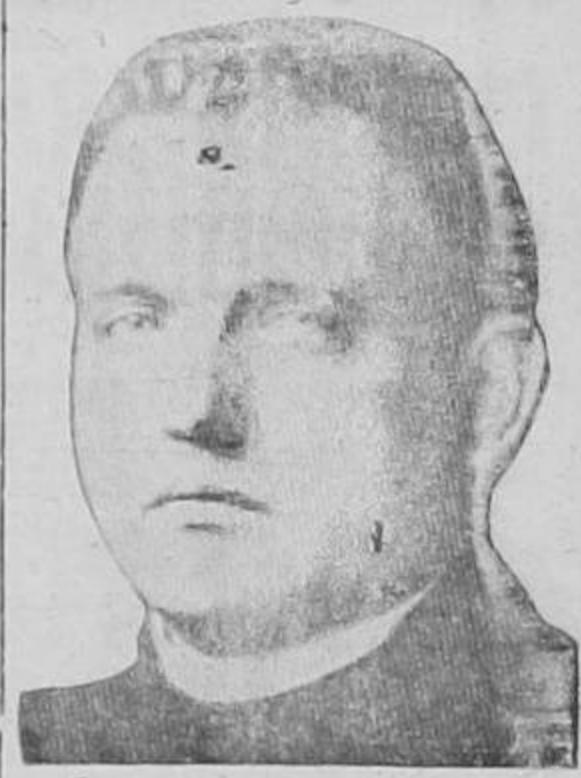
Premier TISO de ESLOVAQUIA

BRATISLAVA, 19. FLASH. — Se han iniciado negociaciones entre los personeros del gobierno eslovaco y alemán, las que según fuentes bien informadas se encaminan hacia la conclusión. —(PASA a la Pág. CINCO)