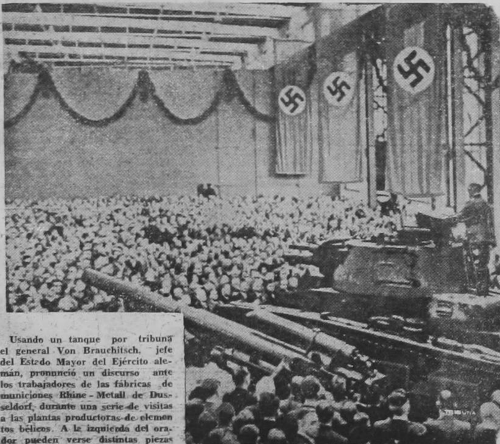
Usando un tanque por tribuna el general Von Brauchitsch, jefe del Estado Mayor del Ejército alemán, pronunció un discurso ante los trabajadores de las fábricas de municiones Rhine-Metall de Düsseldorf, durante una serie de visitas a las plantas productoras de elementos bélicos. A la izquierda del orador pueden verse distintas piezas de artillería.

La respuesta inglesa a la última nota de Hitler originará una nueva contestación de éste