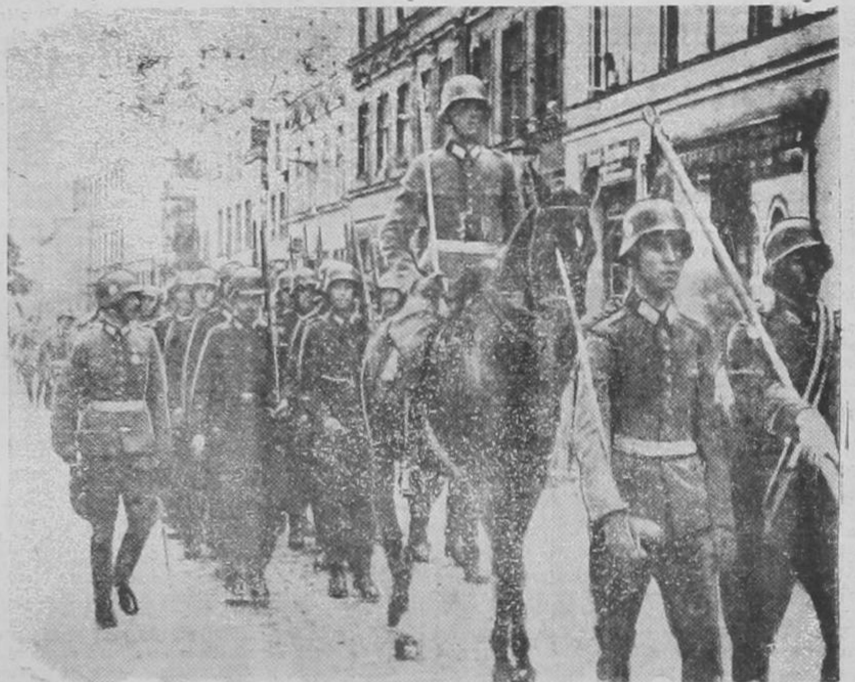
Estos policías de Danzig, que se parecen mucho a los soldados alemanes desfilaron en revista por las calles de la ciudad que quiere reconquistar Adolfo Hitler.

ALEMANIA TODAVIA NO HA CONTESTADO EL MENSAJE A ROOSEVELT.— TAMPOCO LAS OFERTAS DE BELGICA Y HOLANDA PARA LA MEDIACION.— CONTINUAN EN ESLOVAQUIA, PRUSIA, DANZIG Y PRUSIA ORIENTAL, LOS PREPARATIVOS MILITARES A LOS QUE POLONIA TENDRA QUE HACER FRENTE SIN TITUBEO DE NINGUNA ESPECIE