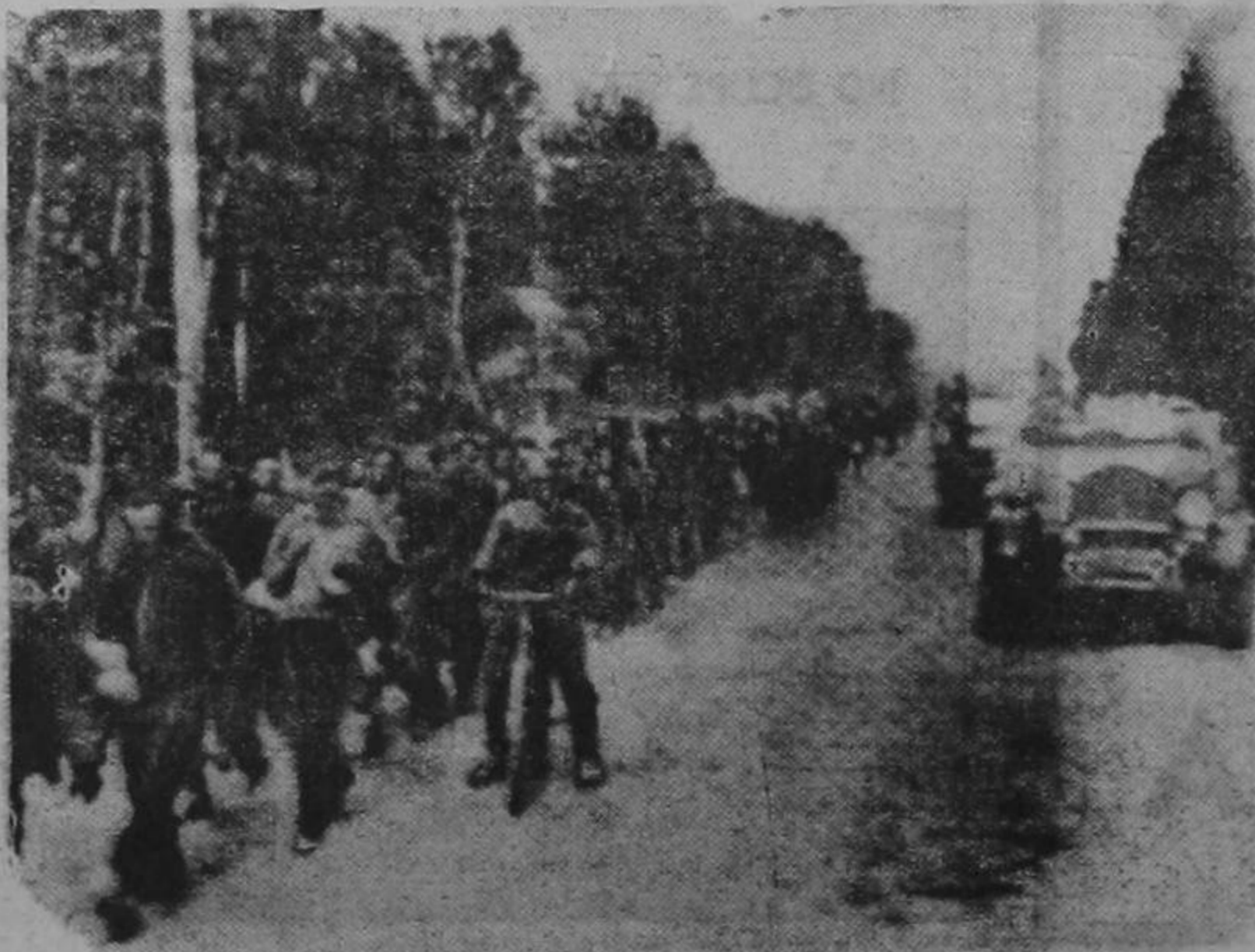
De pie en su automóvil, a la derecha, Adolfo Hitler pasa ante un grupo de prisioneros, polacos, "en un lugar de Polonia de cuyo nombre no quiero acordarme" (Eso, por lo menos, dice la censura alemana que envió esta fotografía, por radio a Nueva York)