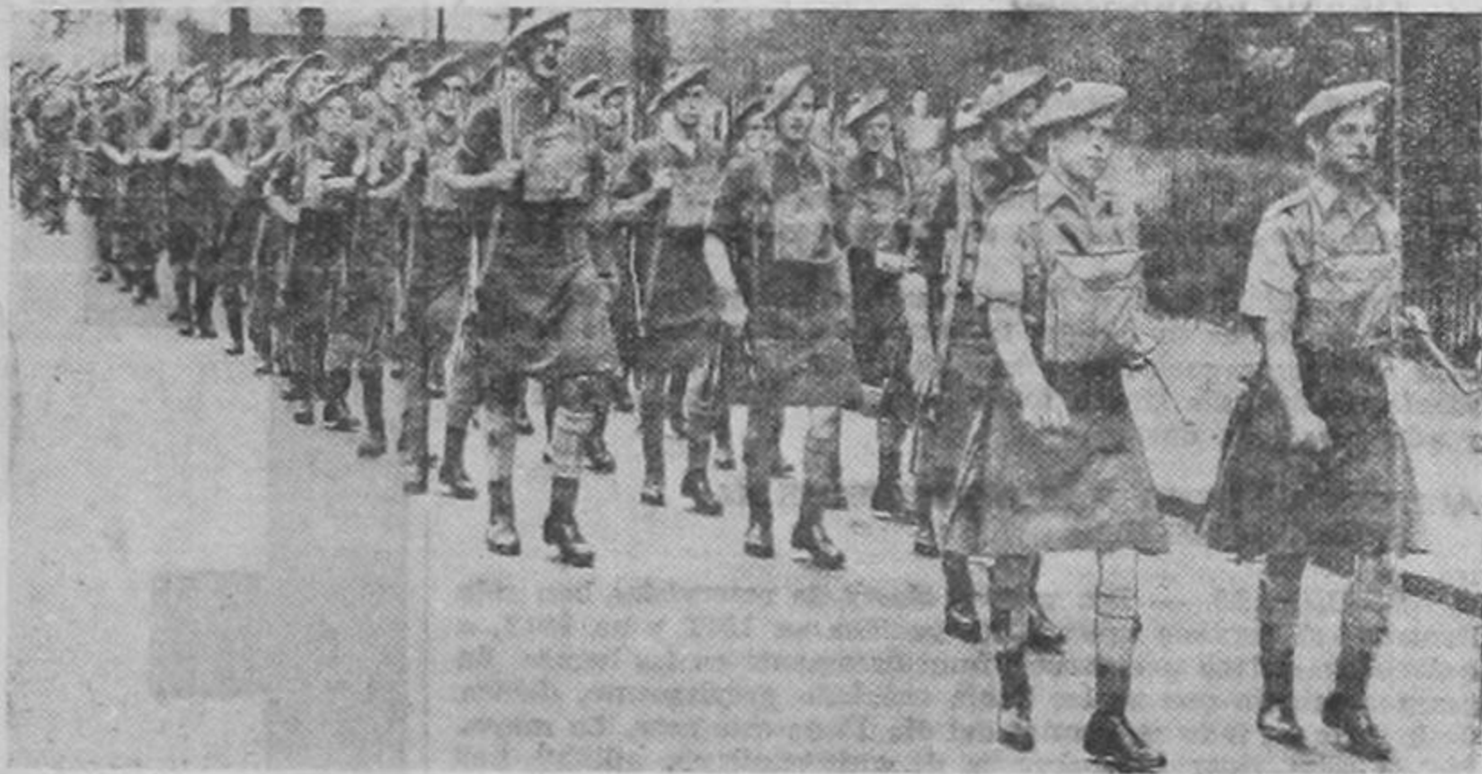
En la guerra pasada, los soldados alemanes llamaban a los "highlanders" escoceses que en vez de pantalones llevan faldas, "mujeres infernales". He aquí un batallón de esas "ladies" desfilando por Londres antes de embarcar para Francia.

Nota importante: Por este medio se comunica a todos aquellos que no han contribuido todavía para el gasto que ocasiona el adorno del altar, lo pueden hacer enviando su contribución a la Casa Curial de la Iglesia de la Merced.