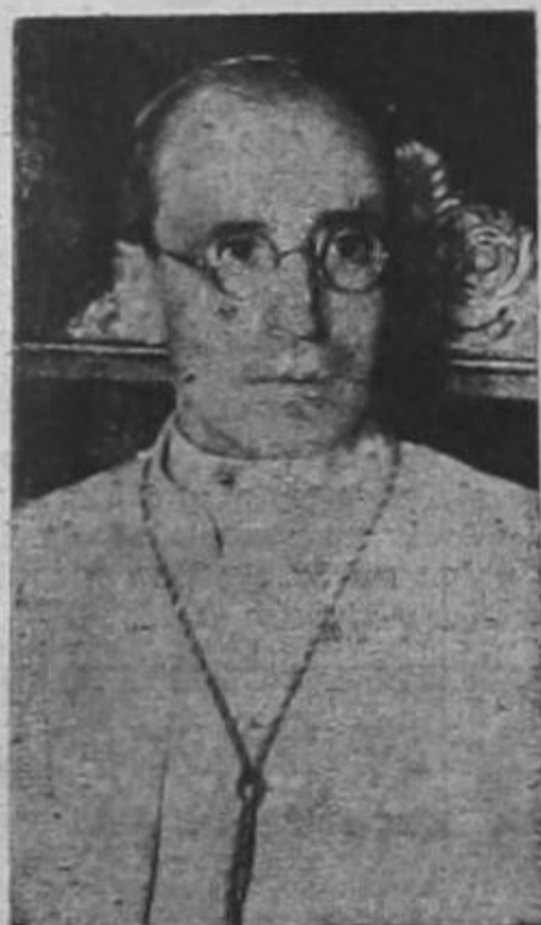
S. S. PIO XII

Autorizadamente dió a conocer hoy esta información la Santa Sede que la UNITED PRESS trasmite a LA TRIBUNA NOVEDADES.—