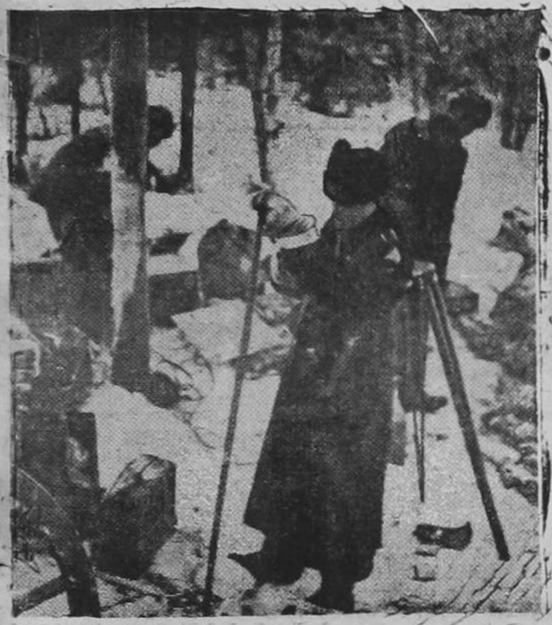
Entre los efectos dejados detrás por los rusos, durante una retirada en Finlandia, se encontraban muchos materiales destinados a la propaganda, tales como películas, aparatos cinematográficos, fotografías, etc. Soldados finlandeses aparecen examinando el botín.

A LAS 6.30 A.M. UNA MUJER DE 26 AÑOS DISPUSO SUICIDARSE LANZÁNDOSE AL PASO DEL TREN DE ALAJUELA, CERCA DEL PUENTE DEL RIO TORRES. —