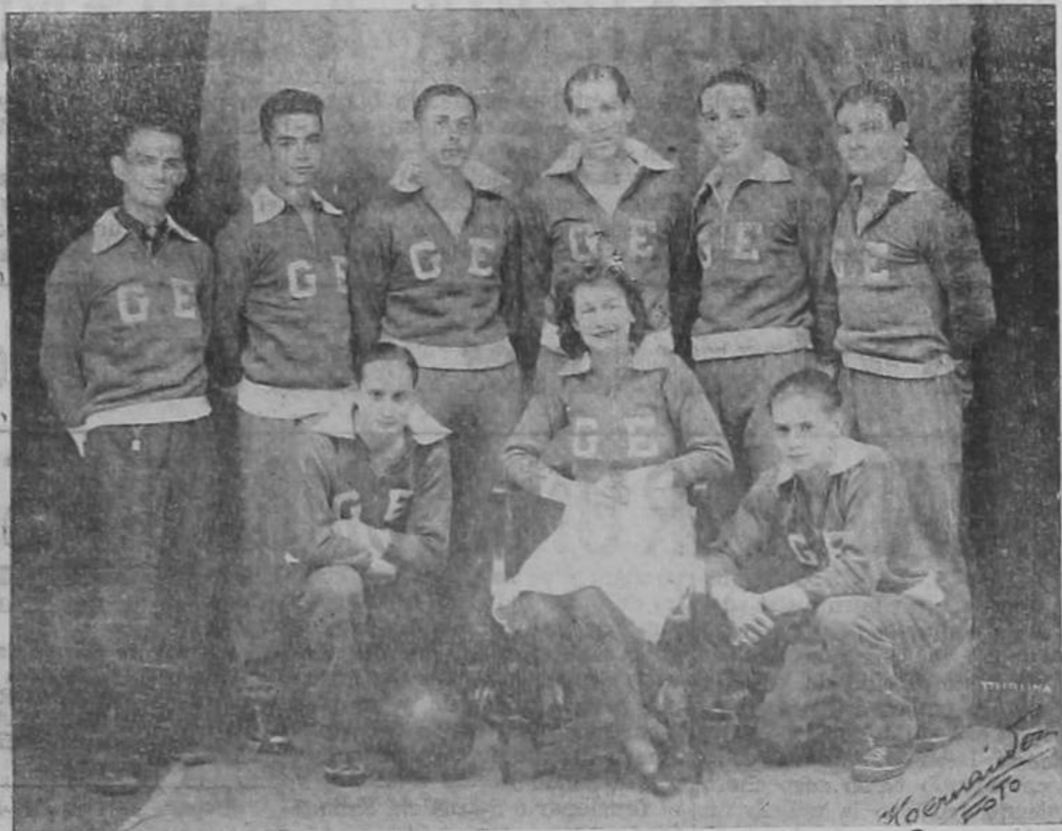
Equipo campeón Nacional de Basket ball, que saldrá en gira deportiva en breve, por El Salvador

Desde hace algún tiempo se iniciaron los preparativos para