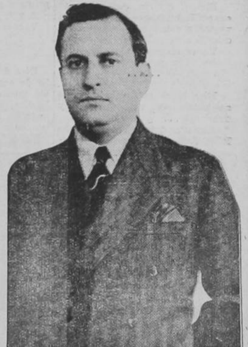
DR. DON RAFAEL A. CALDERON GUARDIA, Por el Partido Republicano Nacional.