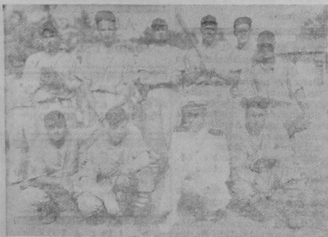
LA FUERTE novena PANDORA integrada toda por marinos del guardacostas americano del mismo nombre, que se enfrentará el sábado el equipo nacional COSTA RICA, en el diamante de la Plaza González Viquez a las dos de la tarde.

El campeonato nacional de ajedrez de Costa Rica se iniciará en la última semana del próximo mes de julio. Éxito desde ahora.