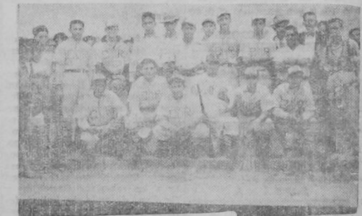
LOS INTEGRANTES del team campeón nacional COSTA RICA, que jugará el sábado un match de beisbol, en la Plaza González Viquez a las dos de la tarde, contra la novena americana PANDORA

Por su parte, la Federación Argentina, que propone se hagan las competencias en Buenos Aires, durante el mes de octubre próximo, ofrece contribuir con buena parte de los gastos que tengan que hacer los boxeadores extranjeros que concurren al mencionado campeonato.