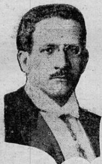
DR. RICARDO J. ALFARO

LOS ELEMENTOS A QUIENES SE DECOMISO ESAS ARMAS Y MUNICIONES SON PARTIDARIOS DEL CANDIDATO PRESIDENCIAL DR. RICARDO J. ALFARO