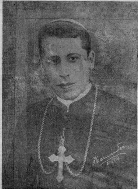
El Sr. Arzobispo Monseñor Sanabria

la solemnisima misa pontificial que oficiara el Excmo. Prelado Metropolitano asistido de los señores canónigos y después del santo sacrificio, cantó un te deum en acción de gracias.