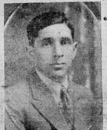
Coronel FERNANDO SOTO GUARDIA