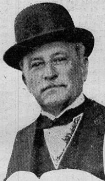
Doctor don RAFAEL A. CALDERON MUNOZ Primer Designado a la Presidencia de la República

SYDNEY, Australia, 8. UP.— El diario Sun en un editorial que publica hoy opina que el debate de ayer en la cámara de los Comunes en Londres "necesariamente tiene que haber desagraviado incluso a los patriotas mejor dispuestos del imperio". Condena la "chocante charpuciería" de las aseveraciones de Chamberlain y hace notar que "aun con la mejor disposición cabe la duda en todo el imperio sobre la capacidad del gobierno británico para dar el impulso necesario al estuerzo de guerra."