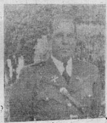
Coronel MANUEL RODRIGUEZ TORRA , Oficial Mayor de Seguridad y Director General de Policía