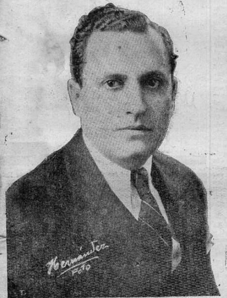
DOCTOR DON RAFAEL ANGEL CALDERON GUARDIA,

LONDRES, 8. UP. — De fuente autorizada se informa que probablemente hoy será entregada por lord Halifax al embajador Maisky la respuesta británica a la última nota soviética sobre las negociaciones comerciales entre ambos países.