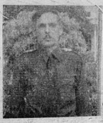
Coronel MIGUEL A. GUARDIA TINOCO , Segundo Comandante de Policía