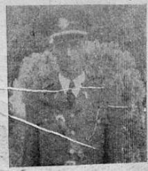
Coronel FRANCISCO GUARDIA SANZ , Primer Comandante del Buena Vista