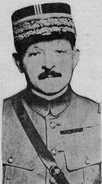
WEYGAND, NUEVO GENERALISIMO ALIADO

MIENTRAS LOS ALIADOS BAJO SU NUEVO COMANDANTE PREPARANSE PARA UNA GRAN OFENSIVA, LAS DIVISIONES AVANZADAS ALEMANAS CONTINUARON SU MARCHA HACIA EL OESTE EN DIRECCION AL MAR ALLENDE SAINT QUENTIN