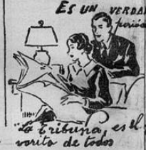
ES UN VERDADERO TRIBUNA, ESTE VUELTO DE TODOS