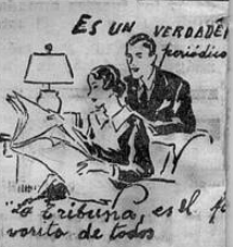
Es un verdadero periódico. La tribuna, es el favorito de todos.