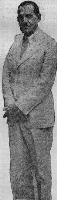
GRAO SAN MARTIN