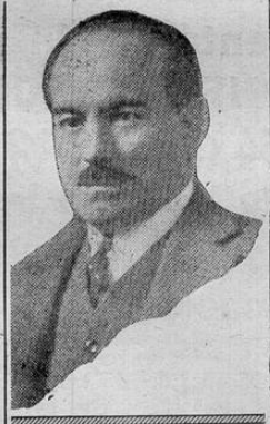
"NOVEDADES" Nº 1332—Director Rafael Soley— Lunes 22 de Julio de 1940

a mis colegas de Costa Rica que nunca he sentido como "Hablo como chileno y como periodista y he de manifestar ahora la obligación de decirles cuan grande es mi confianza en los destinos de América"