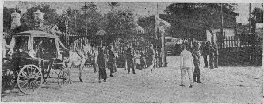
La famosa "puerta" de Gibraltar en territorio español