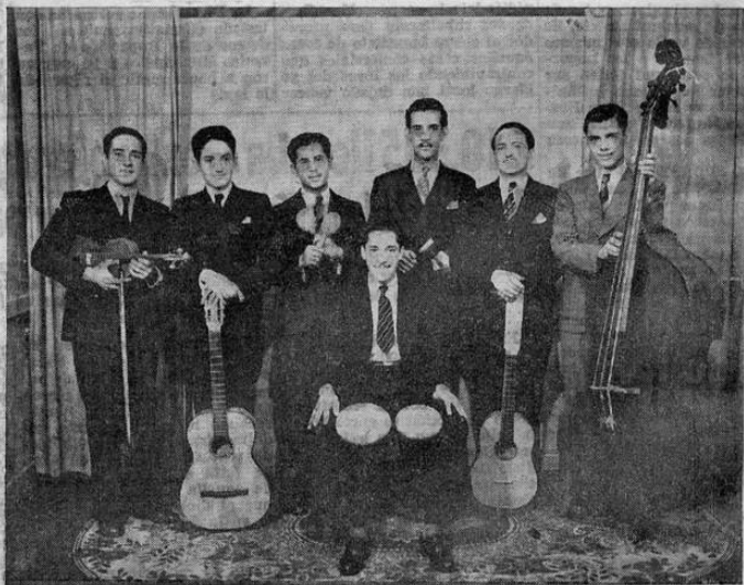
Grupo de aplaudidos artistas que esta noche tomarán parte en la soberbia velada "Ritmo de Cristal" que se ofrece en el Teatro Palace y la que resultará un completo éxito.