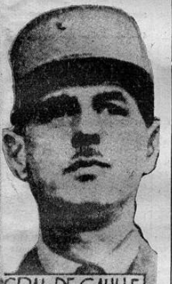
GRAL. DE GAULLE

ROMA, 16 UP. — El comunicado de guerra de hoy anuncia que un bombardeo aéreo efectuado por el enemigo contra los campos de aviación de Massawa y Colbolcia resultaron 4 muertos y 12 heridos. Agrega que (PASA a la Pág. SIETE)