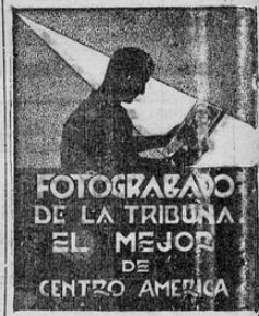
FOTOGRAFADO DE LA TRIBUNA EL MEJOR DE CENTRO AMERICA

este el primer raid que organiza la Federación Nacional de Ciclismo. Sabemos que para el próximo domingo se organiza otra excursión pero no se ha señalado aun el sitio a donde se efectuará. La de ayer fue repetimos todo un éxito.