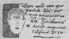
Don solo con eso podrá Ud. ser que anunciar en la Tribuna es éxito asegurado Teléfono 2134

Las agencias de policía de todo el país en este punto han ofrecido un servicio inestimable a la república, ya que a su manera contribuyen la labor docente de inculcar en el concepto ciudadano del derecho cívico un más alto criterio.