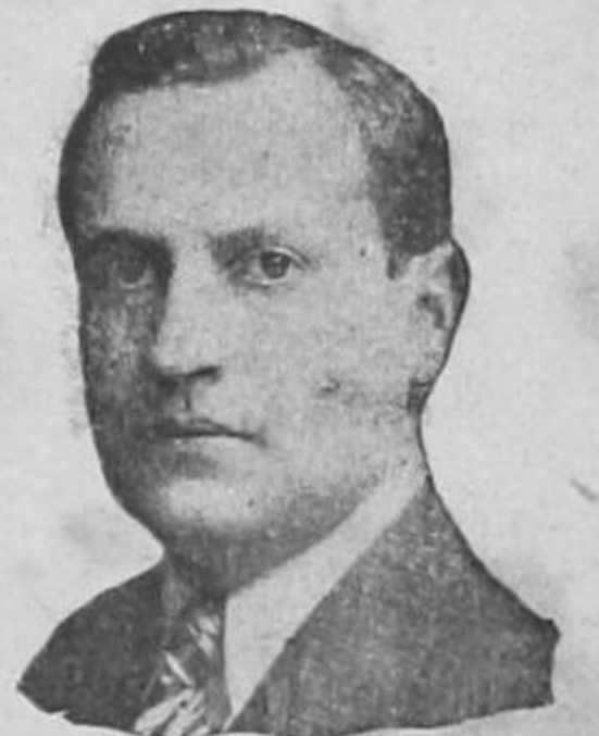
Dr. CALDERON GUARDIA

de terminar las pequeñas diferencias que aun existen, máxime cuando en la actualidad las intenciones expresadas por el Presidente doctor don Rafael Angel Calderón Guardia coinciden comprensivas y fraternales con los mejores propósitos que abrigamos de llegar a una solución magnánima, equitativa e inmediata por parte de los dos gobiernos."