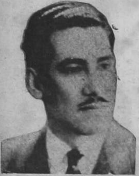
Dr. ARNULFO ARIAS

En forma magnánima y equitativa por parte de los gobiernos, declara el Pdte. Arias