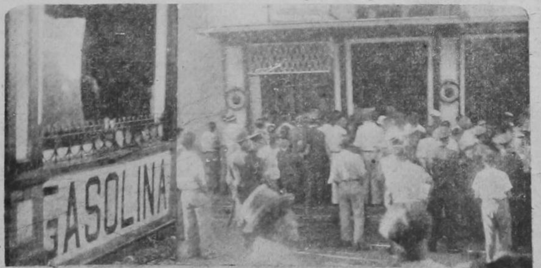
He aquí una composición fotográfica de los instantes que sucedieron al principio de incendio esta mañana a las siete en la bomba de gasolina de Borbón. Puede apreciarse la ausencia de los vidrios de las ventanas que fueron quebrados y grupos de curiosos y pelotón de policiales

LONDRES, 26. UP. — Archibald P. Wavell, comandante de las fuerzas británicas en Asia menor fue ascendido a general. Tenía anteriormente el grado de teniente general.