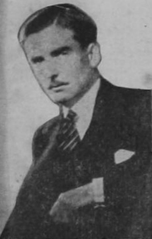
CAP. A. EDEN