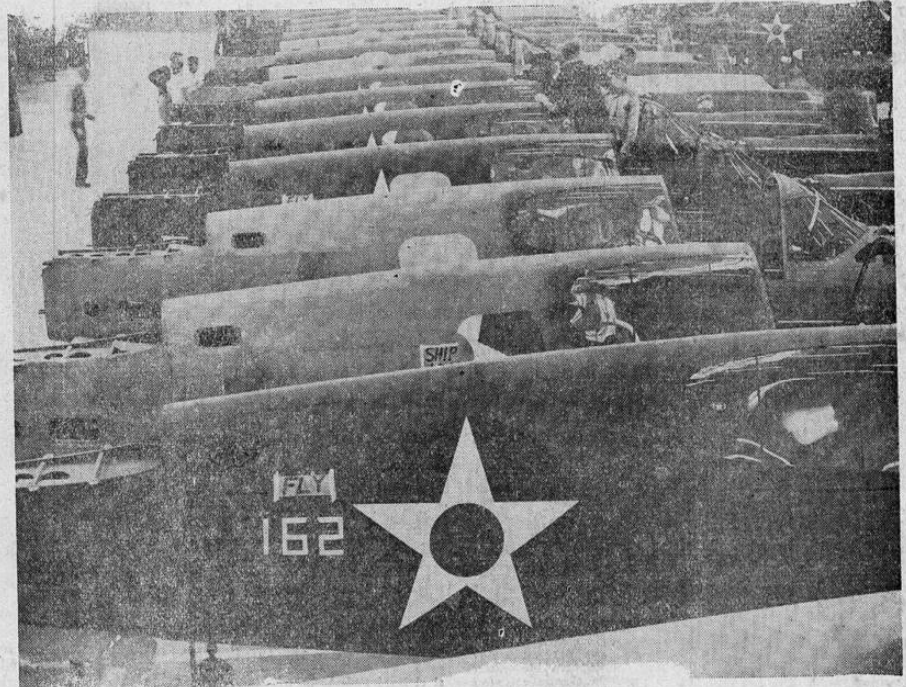
Estos son los fuselajes de los aviones de combate actualmente en construcción en fábrica de aviones de los Estados Unidos, la Custiss-Wright Corporation, en Buffalo, estado de Nueva York