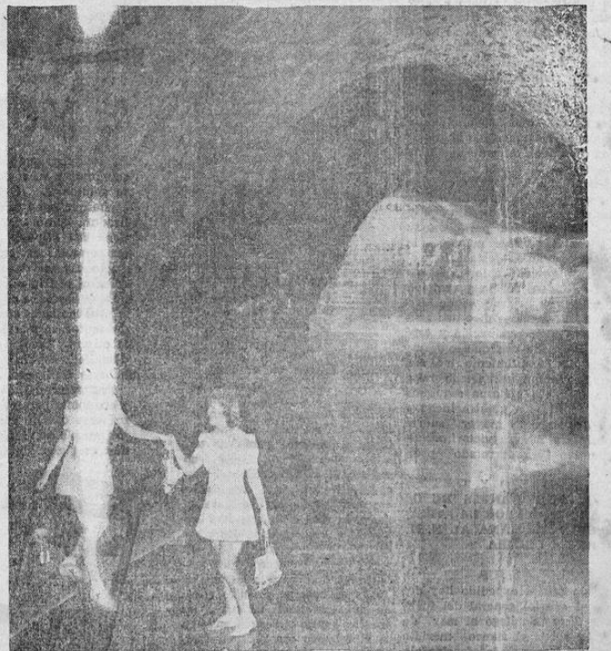
Estas dos jóvenes norteamericanas bajaron a las cuevas que yacen debajo del desierto de lava de Idaho, donde la temperatura pasa de 100 grados Fahrenheit para patinar en el hielo de aquellas, donde este tiene un espesor de 70 pies. Las cuevas se encuentran a 3.000 pies bajo el nivel de tierra.