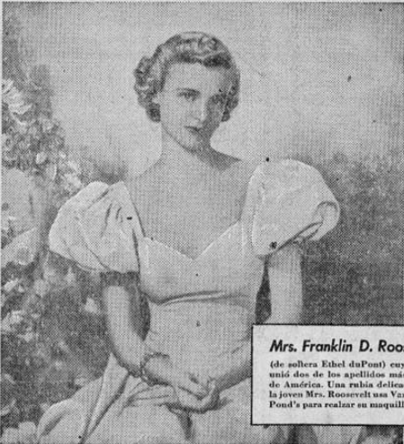
Mrs. Franklin D. Roosevelt, Jr. (de soltera Ethel du'Pont) cuyo matrimonio unió dos de los apellidos más prominentes de América. Una rubia delicada y atractiva, la joven Mrs. Roosevelt usa Vanishing Cream Pond's para realzar su maquillaje halagador.

Suavice el Cutis para hacer más duradero el Maquillaje