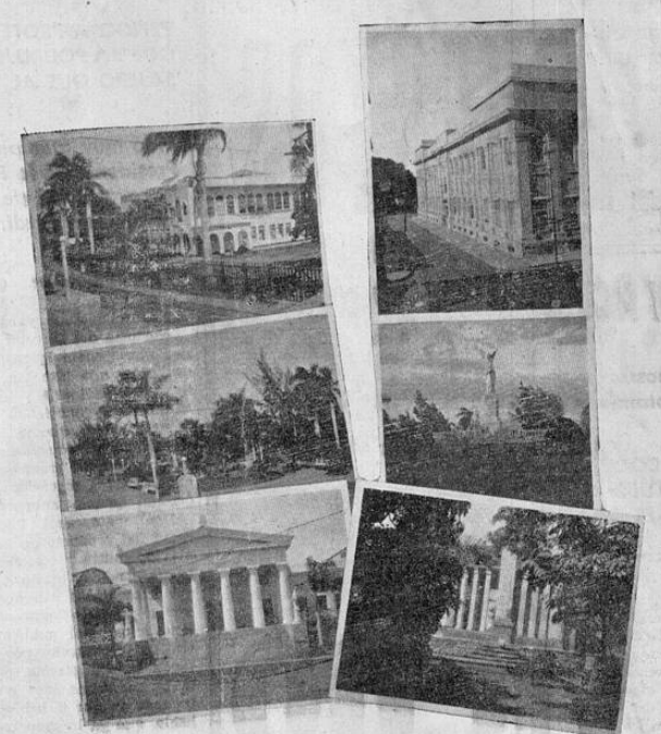
El progreso material realizado en la capital de Nicaragua ha sido sumamente intenso en los últimos dos años. Las fotos que damos a conocer revelan algunos aspectos de la nueva Managua, reconstruida después del terremoto y embellecida constantemente. Puede apreciarse, arriba; Las oficinas del ferrocarril y el Palacio Nacional; al centro, uno de los parques y el monumento a Rubén Darío y, abajo el Templo de la Música y el Ayuntamiento.