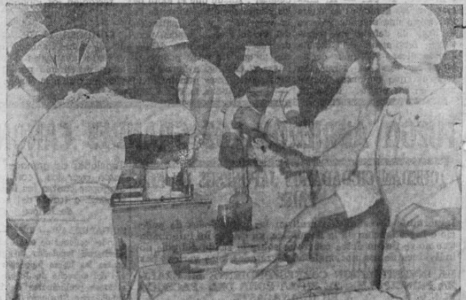
Fotografía tomada en un hospital de Honoúlu mientras se tomaba sangre a los donantes voluntarios para ayudar a las víctimas del ataque a Hawaii.