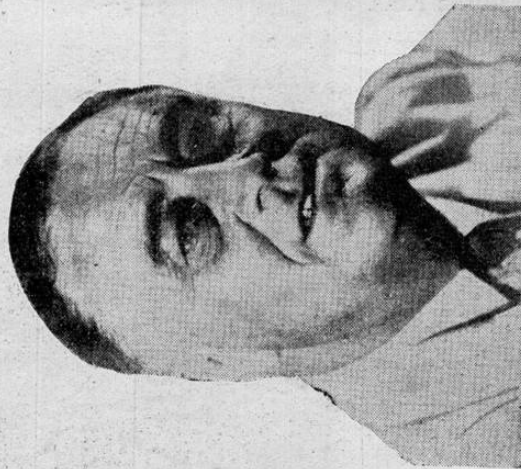
Franklin Delano Roosevelt

Cuyo jubileo de diamantes se celebra hoy en todo el mundo de la civilización, a quien la FABRICA NACIONAL DE LICORES rinde también homenaje de simpatía y admiración. En estos momentos históricos, la figura del "líder" de la democracia mundial se agiganta y toma proporciones que abarcan el futuro de la humanidad entera. Sea esta la ocasión propicia para saludarlo con sincera emoción.