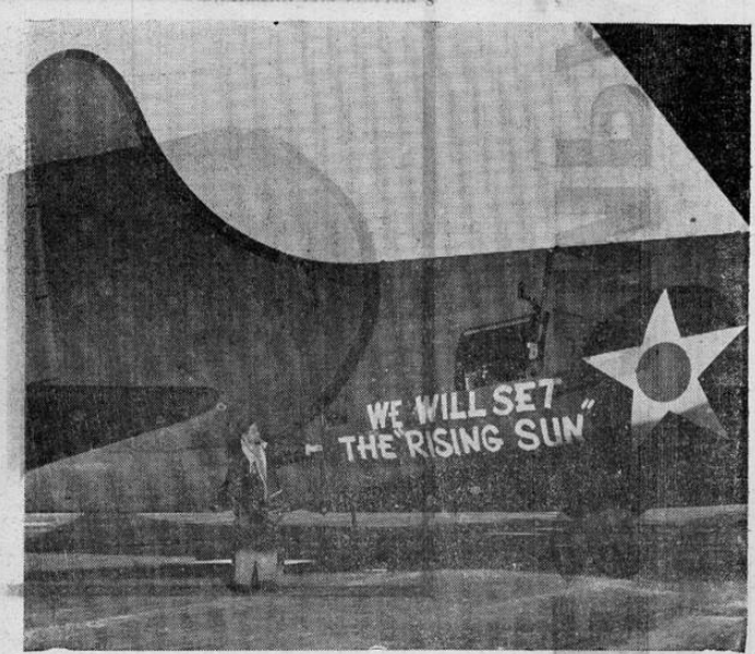
El lema adoptado en los aviones pesados de bombardeo norteamericano dice: "We will set the rising sun" (Pondremos el sol naciente). Con eso los pilotos aviadores norteamericanos dicen en pocas palabras lo que piensan hacerle a los nipones.

LISBOA, 1º — Entró hoy en vigor el nuevo racionamiento de gasolina cuya venta a los automóviles particulares, entidades del Estado, cuerpos administrativos, embajadas y legaciones extranjeras se autoriza solamente contra presentación de las tarjetas de racionamiento.