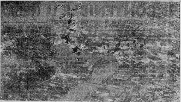
MANHA, la capital de las islas Filipinas — la más cercana al área de acción japonesa, que el 2 de este mes cayó en poder de los nipones.

BUENOS AIRES, 1º — Poco después del medio día se informó en la cancillería que el ministro de Relaciones exteriores doctor Ruiz Guinazo aun se encuentra en Río de Janeiro ya que el avión Lockheed de la armada argentina que partió de esta capital para traerlo de regreso sigue detenido en la localidad brasileña de Paranaguá por persistir las condiciones adversas del tiempo. Se espesa que mañana el avión naval pueda proseguir viaje como consecuencia, el