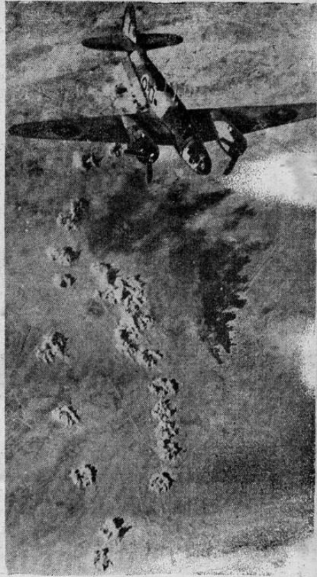
Avión bombardero inglés descargando sus bombas en el desierto de Libia contra una columna mecanizada del Eje.