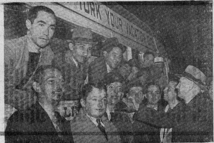
El primer contingente de 526 jóvenes hispanoamericanos fotografiado al llegar a Nueva York, de donde continuaron rumbo a distintas escuelas para adiestrarse como pilotos aviadores, ingenieros y mecánicos de aviación.—(Foto Acme-Editors Press).

ta de la Cirenaica. Ignórase todavía se la acometida sobre Marawa partió desde Bengasi o desde Msus, pero parece más probable que haya sido desde el primero de esos puntos ya que las columnas procedentes de Msus tratan de avanzar a través de las tormentas de arena esporádica en dirección a Mekili. Si las fuerzas del Eje logran apoderarse de Marawa, y no hay confirmación alguna de que lo hayan logrado ya, podrían emprenderse una doble acometida sobre Mekili a su vez probablemente sería posible avanzar en dirección a Derna hacia el nordeste y a Ain el Gazala, casi el E. Mientras tanto las fuerzas imperiales enfrentan esas tentativas del Eje con todos los elementos a su alcance que incluyen una abrumadora superioridad aérea, una indiscutible superioridad naval y cuando menos igualdad en elementos mecanizados y poder humano en tierra. La mayor parte del tiempo los convoyes enemigos no pueden utilizar la espléndida ruta pavimentada de 1,600 kilómetros que va desde Tripoli a la frontera egipcia y que constituye el orgullo militar de Italia. La escuadra británica en cruceo en aguas afuera de la costa vigila constantemente sobre aquella haciéndole virtualmente intransitable para las caravanas motorizadas. Las reales fuerzas aéreas se multiplican en su acción contra la nueva ofensiva del Eje martillando incansablemente contra las concentraciones de tanques y camiones en puntos situados muy a la retaguardia del frente, así como contra las columnas enemigas en mar