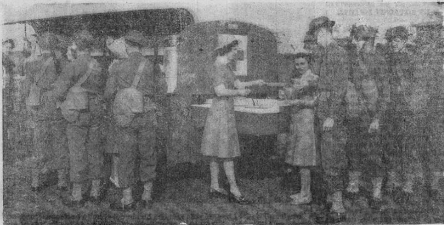
La cantina modesta de la primera guerra mundial, ha dado paso a este tipo más moderno y completamente mecanizado

Este documento es propiedad de la Biblioteca Nacional "Miguel Obregón Lizano" del Sistema Nacional de Bibliotecas del Ministerio de Cultura y Juventud, Costa Rica.