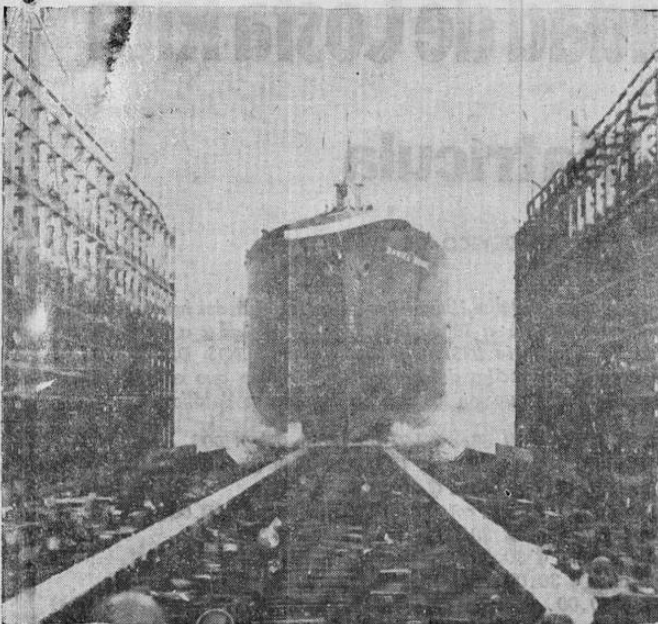
El "Daniel Boone", de la Flota de la Libertad, en los momentos de ser botado al agua en los astilleros de Long Beach, en California.