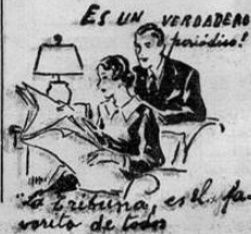
ES UN VERDADERO periodico! La tribuna, es la fuente de todo