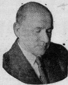
EXCMO. SR. GEORGE P. LYALL

sobre la tierra, para peligro del mundo, España estará presente. El editorial sale así al encuentro de las especulaciones extranjeras, e insiste en destacar que "no hay re