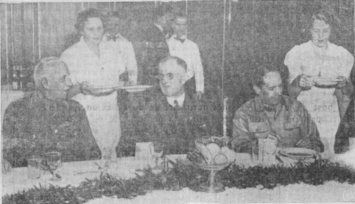
El general Douglas MacArthur, sentado a la derecha, jefe supremo de las fuerzas Aliadas en el Sudoeste del Pacifico, fotografiado durante una comida que en su honor ofreció el Parlament Federal de Australia. A la izquierda, en la foto, se encuentra el gobernador General, Lord Gowrie, y al centro, el Primer Ministro de Australia, John Curtin.