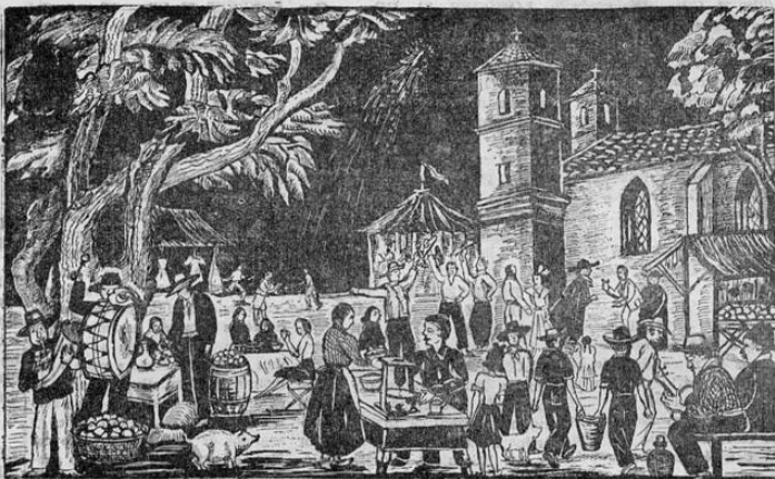
La fiesta del Santo Patrono con gran derroche de música y alegría