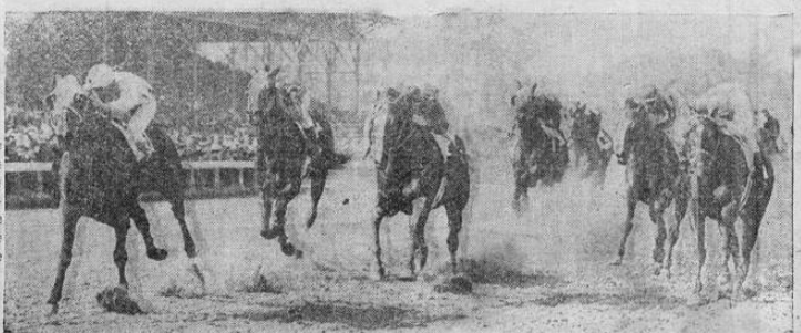
Momento en que "Alsab", el caballo que fué campeón de los equipos de dos años en 1941, ganaba la famosa carrera del "Preakness", en el hipódromo de Pimlico, en E. U. A., estableciendo un record de velocidad y ganando para su dueño la respetable cantidad de