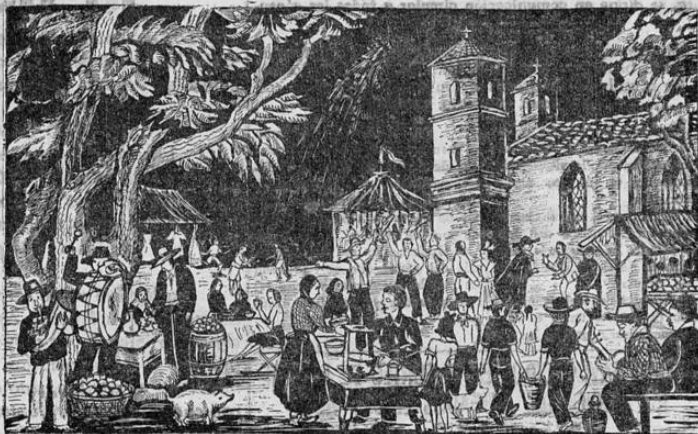
La fiesta del Santo Patrono con gran derroche de música y alegría