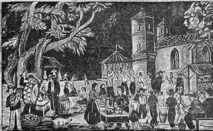
La fiesta del Santo Patrono con gran derroche de música y alegría