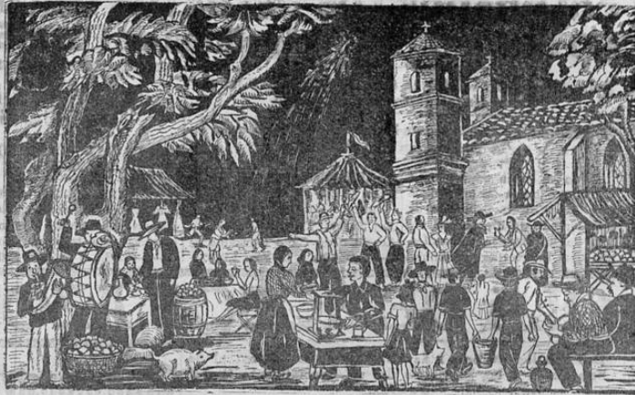
La fiesta del Santo Patrono con gran derroche de música y alegría