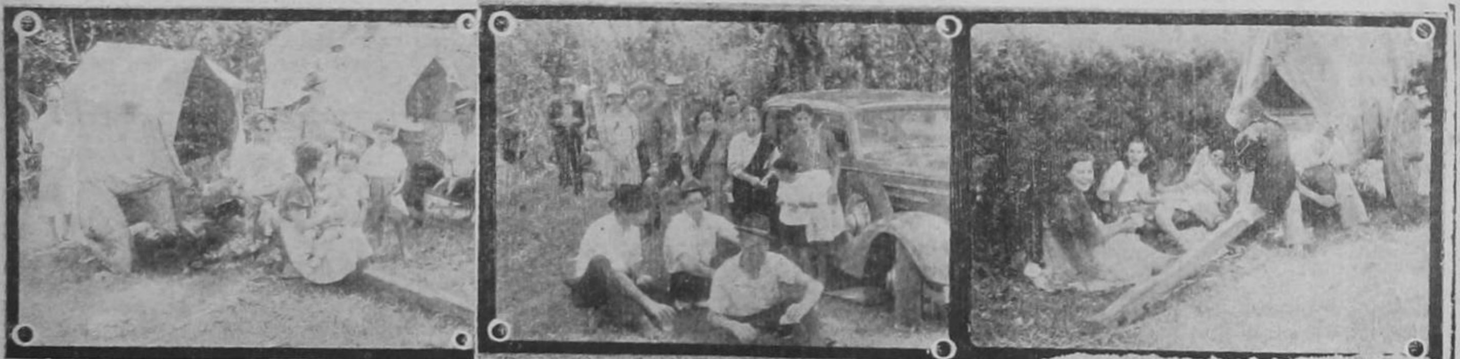
Con extraordinaria animación y alegría se celebraron ayer las festividades religiosas y la romería al Santuario de Esquipulas, en la vecina villa de Alajuelita. Las fotos que ofrecemos recogen diversos aspectos de esas festividades, cívicas y religiosas.

San José-Costa Rica, Lunes 18 de Enero de 1943