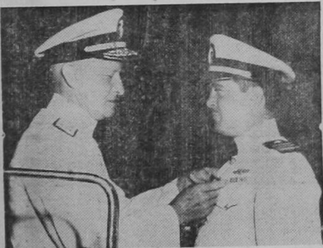
El Almirante Chester Nimitz, comandante de la flota del Pacífico, condecora al Capitán de corbeta Thomas B. Klakring con la Cruz Naval de los Estados Unidos. En un solo crucero durante el cual llevó su actividad bélica hasta el interior de los mismos puertos japoneses, Klakring hundió más de 70.000 toneladas de barcos enemigos.