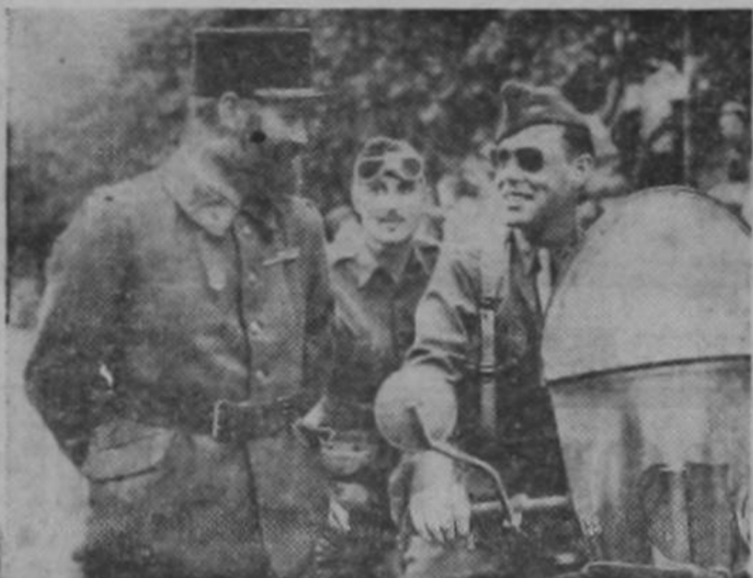
El comandante de un batallón de tropas norteamericanas que se dirigen a ocupar posiciones en las líneas avanzadas del frente tunisino, se detiene a conversar con un soldado francés. Poderosos refuerzos han estado llegando a este sector para desalojar a los nazis del territorio que todavía ocupan en el Africa Septentrional Francesa.