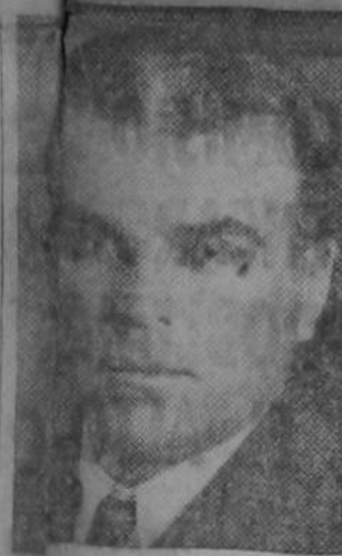
General La Verne Saunders

Una granada explotó en la cabina, matando al piloto e hiriendo gravemente al ayudante del piloto.