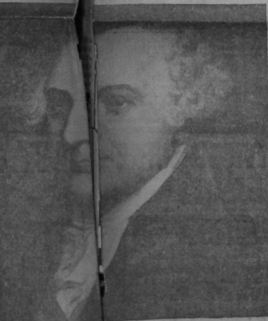
John Adams, de Boston, uno de los más destacados jefes del movimiento que precedió a la guerra de independencia y firmatario de la Declaración de Independencia de los Estados Unidos. Fué el primer vicepresidente y luego el segundo presidente de los Estados Unidos. Murió el 4 de julio de 1826, fecha del quincuagésimo aniversario de la adopción de la Declaración de Independencia.