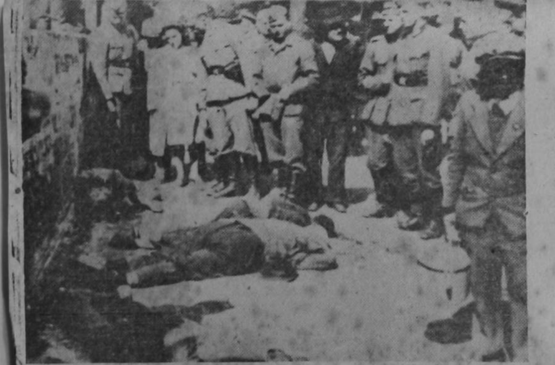
Esta fotografía, encontrada a un oficial alemán capturado en Africa, es un documento más sobre las atrocidades cometidas por los nazis en la isla de Creta: los indefensos ciudadanos, por el solo delito de ser patriotas, han sido fusilados ni más ni menos que como si se tratara de perros.