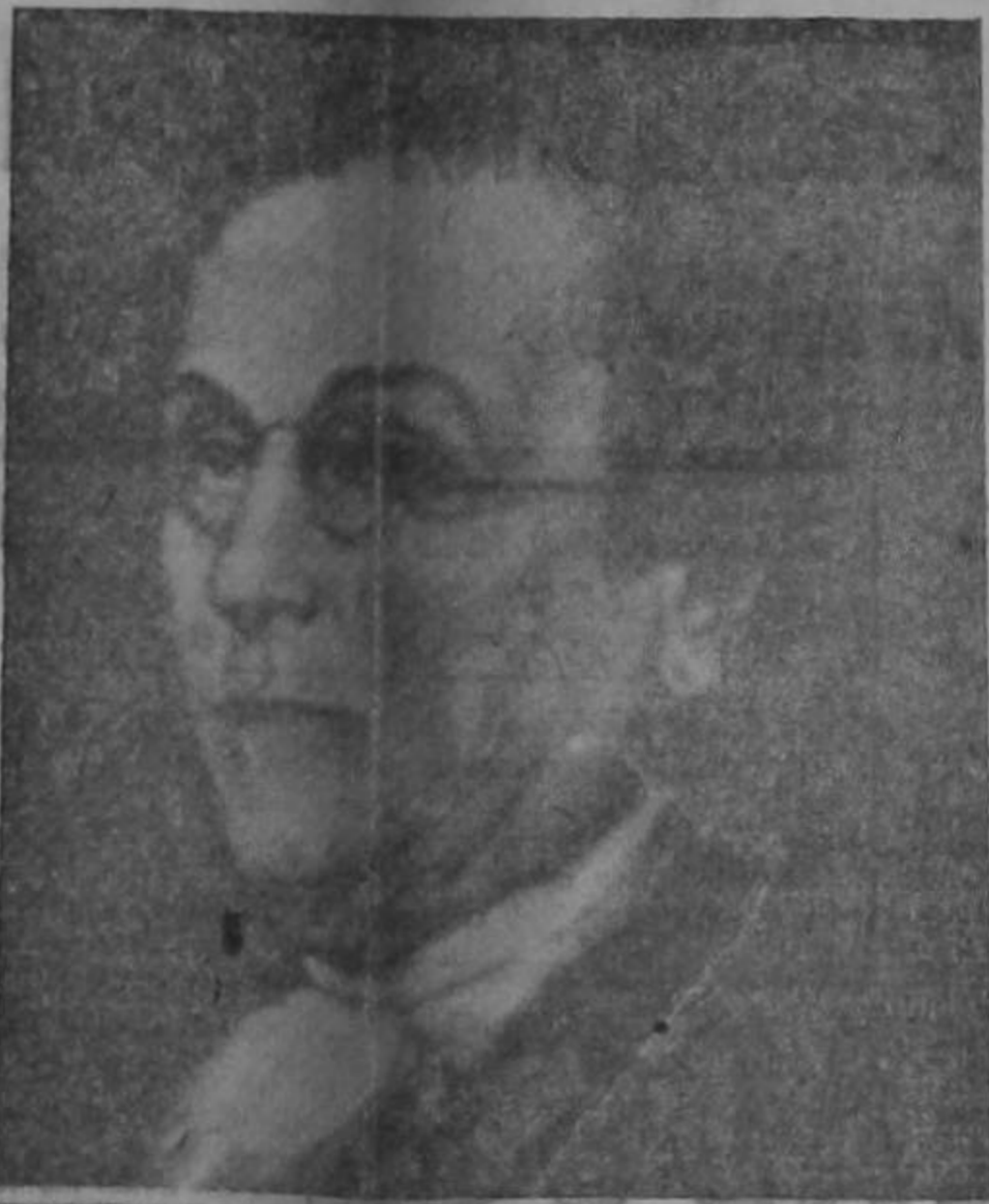
Benjamin Franklin, estadista y filósofo, firmó la Declaración de Independencia de los Estados Unidos adoptada en Filadelfia el 4 de julio de 1776. Gracias a sus inteligentes esfuerzos se obtuvo la ayuda de Francia al movimiento americano de independencia. (Oleo de Peale.)