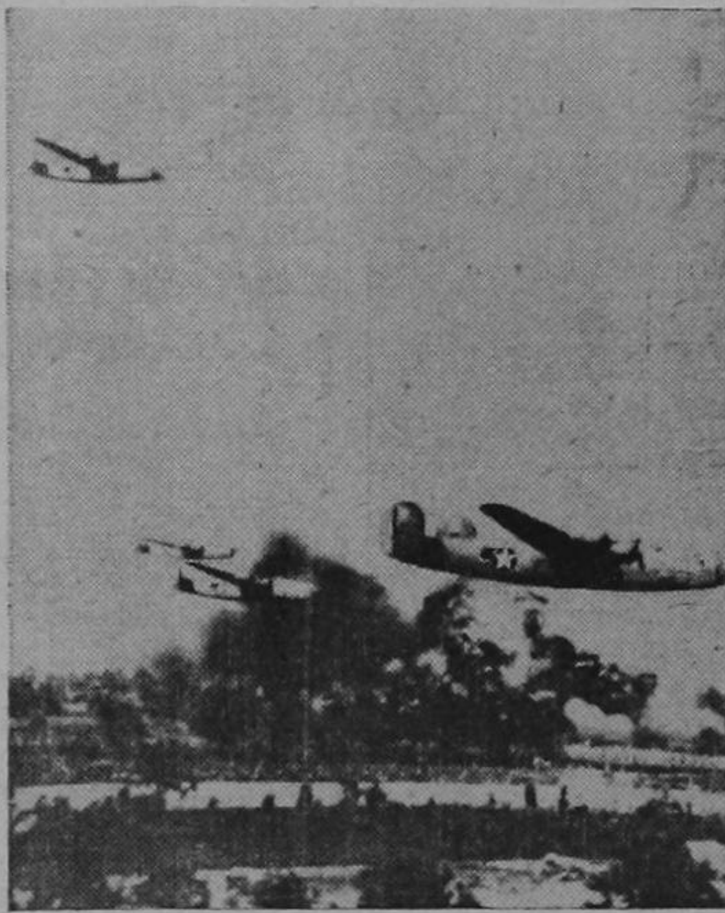
Bombarderos "Liberator" norteamericanos efectúan un ataque a baja altitud sobre refineries y depósitos de petróleo nazis en Ploesti, Rumania. El humo y las llamas marcan el paso de los aviones estadounidenses, a medida que las bombas de tiempo estallan en la principal fuente de gasolina para la aviación alemana. (Fotografía transmitida por radio a Nueva York.)