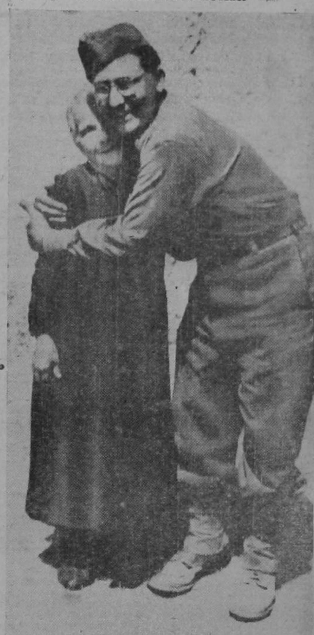
Centenares de soldados de los Estados Unidos que pertenecen a las fuerzas que invadieron a Sicilia reanudan relaciones de familia que la guerra interrumpió. Aquí se ve a un soldado estadounidense de los que ocuparon a Gela, Sicilia, abrazando a su abuela, quien le reconoció por una fotografía. La foto fué transmitida a Washington por radio desde Argel.