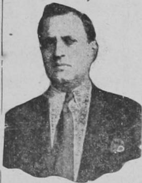
Dr. CALDERON GUARDIA

El presidente escuchó las demandas de los trabajadores limonenses en favor de la provincia y ofreció una rápida solución