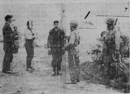
Soldados estadounidenses se mantienen alertas, pistola en mano, junto a estos soldados nazis hechos prisioneros durante una misión de patrulla. Los alemanes estaban escondidos en una casa de campo desde donde disparaban contra los aliados.

colmo y después de la legación soviética en Estocolmo no será suficiente desde un punto de vista del gobierno finlandés.