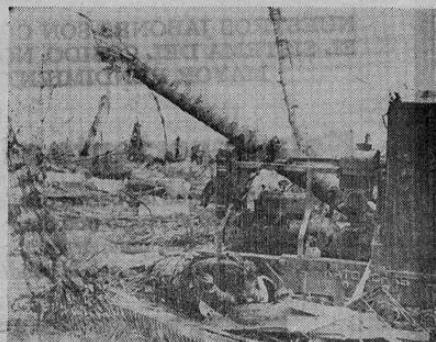
Cadáveres japoneses, máquinas destrozadas y troncos de cocoteros arrancados dan una idea del destructivo bombardeo aéreo y naval de la isla de Namur, del archipiélago de las Marshall, en el Pacífico central, como preliminar para el desembarco de las fuerzas de los Estados Unidos. Las bases japonesas cayeron una tras otra después de cuatro días de furiosa lucha. Las pérdidas del enemigo fueron tremendas.