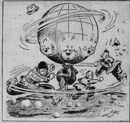
Smith en el Cleveland Press.