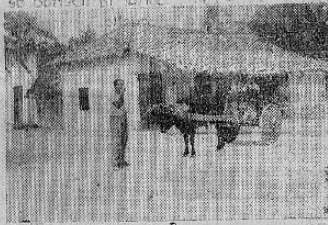
LIBERIA — Curiosa carreta tirada por un sólo buey en la blanca ciudad de Liberia.