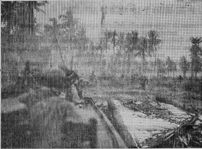
Fuerzas de los Estados Unidos se lanzan al ataque contra posiciones japonesas en la isla de Los Negros, del archipiélago del Almirantazgo, en el suroeste del Pacífico. La ocupación de esta isla y de la de Manus, cercana a ella, ha proporcionado a los Estados Unidos el dominio del Mar de Bismark, quedando aisladas las guarniciones japonesas de las islas Salomón y Nueva Guinea.