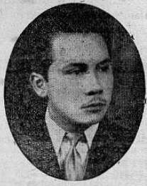
Samuel Antonio Carmona

Hace dos años cayó en el cumplimiento de su deber, luchando por su causa durante la guerra civil, don Samuel Antonio Carmona. Elemento distinguido en los campos del trabajo como hombre honrado, leal y sincero. No fué en vano su sacrificio: ante el desastre en que actualmente se debate el país se destaca la nobleza de su causa; cayó como muchos luchando por la conservación de nuestra tradición democrática.