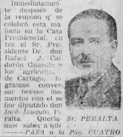
Sr. PERALTA —PASA a la Pág. CUATRO

Esta mañana se nos encargó en la Secretaría de Agricultura poner en conocimiento del público en general, que esa dependencia ha recibido una pequeña cantidad de semilla de adlay, la que se dedicará a la distribución. Como se sabe el adlay se obtiene una harina que es sumamente usada, muy semejante a la de trigo, pero de distinto sabor, que sin embargo, puede servir para la alimentación de la familia con éxito en sus propiedades en general. Debido a que solamente se recibió una cantidad poca, los interesados se dará solamente una pequeña cantidad.