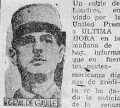
GENERAL DE GAULLE

Un cable de Londres, en viado por la United Press a ULTIMA HORA en la mañana de hoy, informa que en fue en las portales americanas dignas de crédito se ha dado la noticia de la renuncia del general Charles de Gaulle como copresidente del comité nacional de liberación.