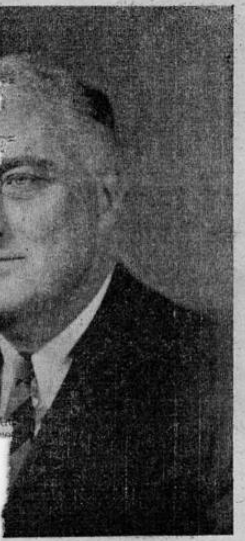
FRANKLIN D. ROOSEVELT

idente, en parte, dice: a bandera no está combatiendo as de 32 Naciones Unidas mar- ca adelante por la voluntad de oj, son el emblema de una ofen- siva mundial. Como hermanos en Naciones Unidas hemos empu- sado fuerzas hasta que la victoria zasegurada. nuestras flotas y nuestras fuer- zan su cooperación con los Ali- ayuda de Dios, se logrará la vic- que la humanidad, amante de Reforzados por nuestros comu- el futuro con resolución y nue- al logro de una colaboración ones y la seguridad de la huma- nidad con cooperación podremos establecer una paz duradera".