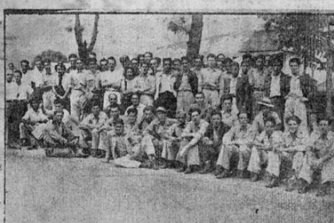
Partido de los huelguistas posan para ULTIMA HORA

Inmediatamente después que el Sindicato de Obreros metalúrgicos decretó anoche la huelga, salió una comisión de obreros a avisar a sus compañeros que se encontraban trabajando, y pedir la salida de obreros, pero una orden recibida posteriormente les notificó no oponer ninguna resistencia. — Todos los demás trabajadores que debían entrar después de las tres de la mañana, quedáronse en la calle, plegándose a la huelga.