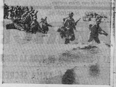
Las primeras tropas norteamericanas que desembarcaron en las costas de Sicilia se lanzan con ímpetu a la conquista de los más importantes objetivos que les han sido asignados. Foto radiotransmitida de Argel a Washington.