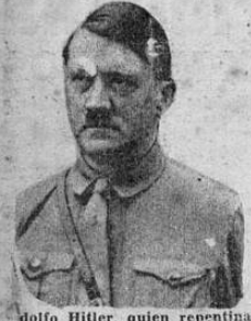
Adolfo Hitler, quien repentinamente reunió hoy a sus generales dándoles la orden optimista de no ceder un palmo más de terreno a los ejércitos rusos.

El Quinto Ejército tomaron por asalto un cuartel general alemán y apresaron a un general que se encontraba durmiendo y a numerosos otros jefes aversarios sin disparar un solo tiro.