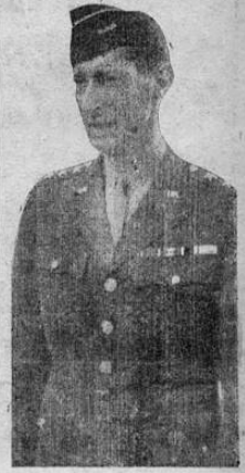
Teniente Gral. Mark Clark, quien conduciendo al 5º Ejército, comenzó hoy la ocupación de Nápoles.

En el Parque Central hubo varios discursos y luego se dirigió el desfile hacia el monumento a Juan Rafael Mora situado frente al edificio de correos y telégrafos, en donde fue depositada una ofrenda floral al benemérito hijo de la patria.