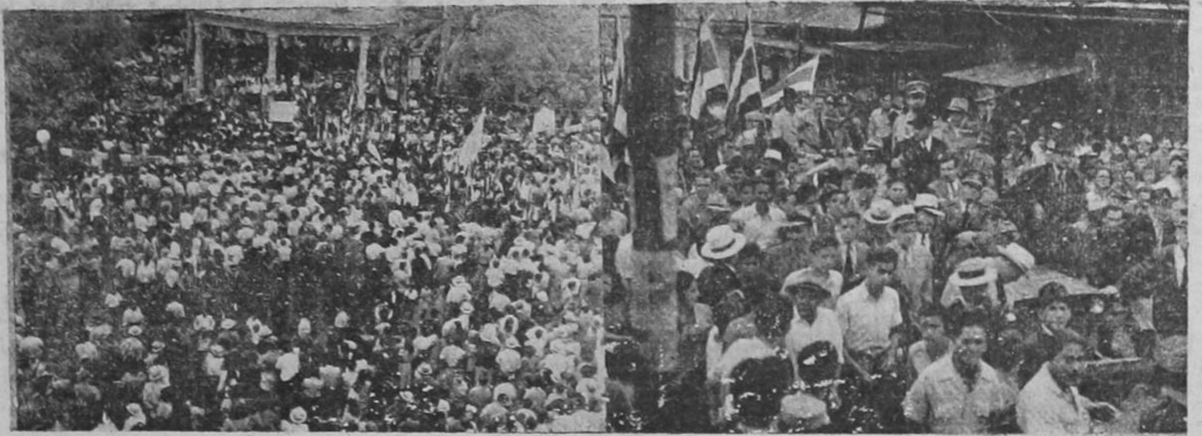
En primer término, la multitud que en Heredia se "apelotonó" alrededor del kiosco, donde estaba la tribuna oficial. — Luego, el jeep que conducía al doctor Calderón Guardia y sus acompañantes, abriéndose paso lentamente a través de la muchedumbre que quería contemplar el paso del Jefe del Estado.

Las primeras horas del domingo, fueron vividas por la ciudad de Heredia en una de sus más inusitadas manifestaciones, como quizás no se recuerden en la historia de esta bella ciudad. He PASA a la Pág. OCHO—