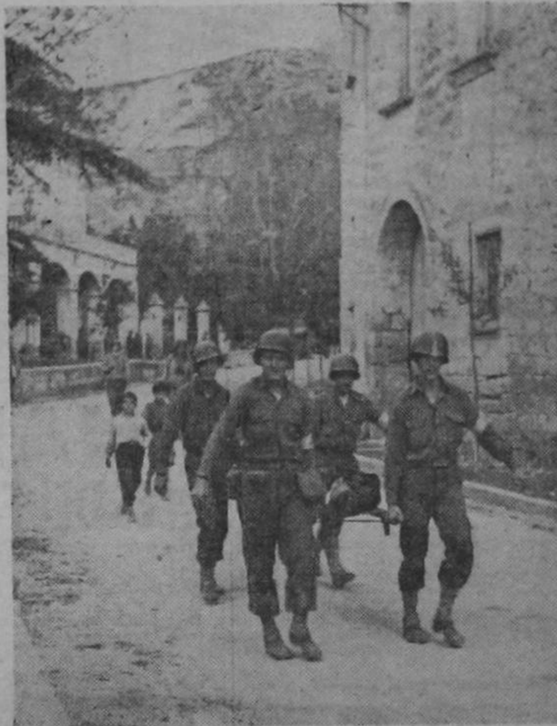
Camilleros del ejército de los Estados Unidos atraviesan las calles de una aldea italiana conduciendo a soldado al hospital de campo. Fotografía tomada durante la batalla en que quedaron rotas las líneas alemanas en el Volturno.

LONDRES, 20. UP. — Los círculos oficiales de Londres informaron no tener noticia de la invasión de Samos por los alemanes, anunciada por radio Martine y añadieron que la guarnición británica de la isla era pequeña y probablemente ya se ha retirado de ella por completo.