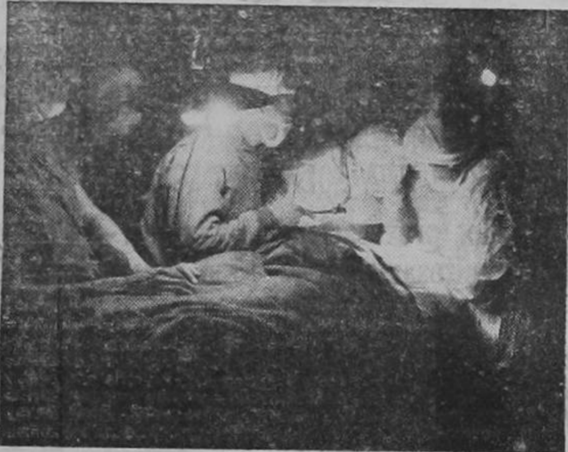
Médicos del ejército de los Estados Unidos practican una operación de emergencia en un hospital de sangre cerca del frente de combate italiano. Nótese la rudimentaria iluminación usada por esos abnegados médicos del ejército.