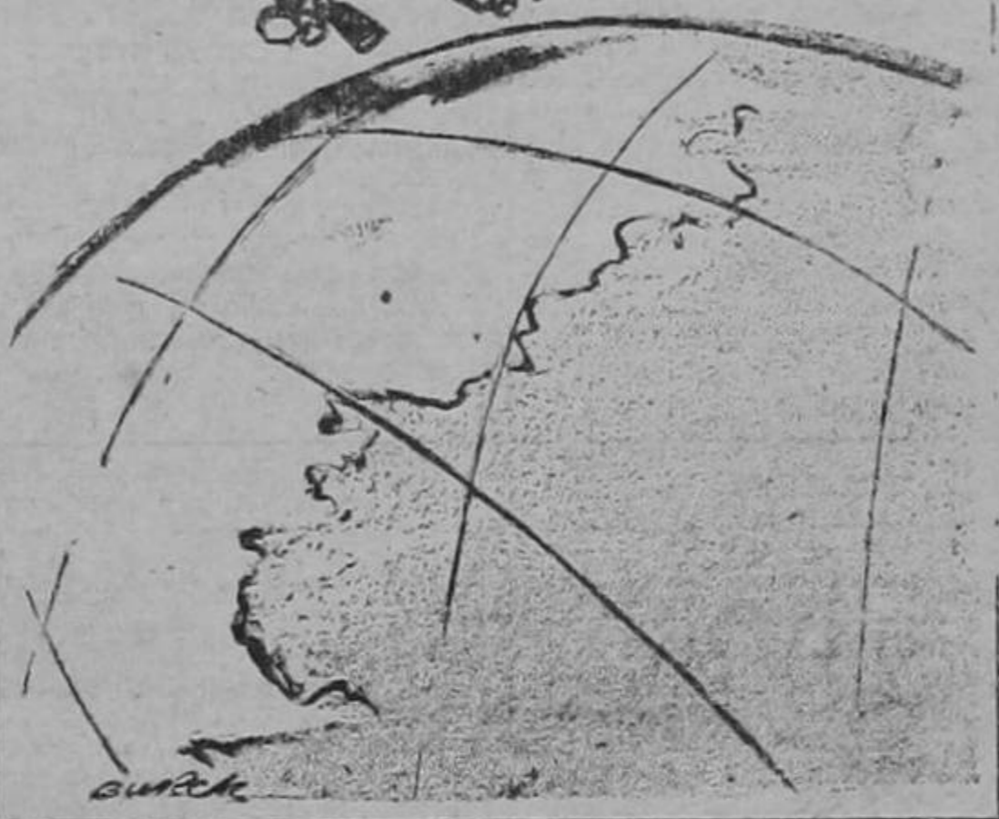
Burek en el Chicago

NUEVA YORK, 28. UP. — Radio de Tokio informó que la aviación nipona atacó el cabo Gloucester y las posiciones estadounidenses de la isla Long. Los resultados, según la emisora, fueron de escasa importancia.