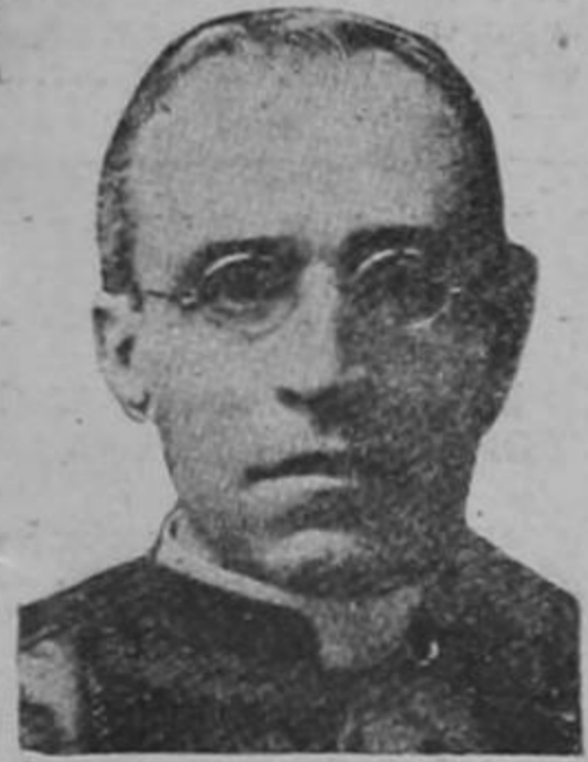
EL PAPA PIO XII

quien declaró que el bombardeo del 5 de noviembre contra el Vaticano fué deliberadamente planeado