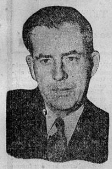
La única manera de sostener la paz después de la derrota de Hitler, es liquidar asolutamente todas las fuerzas de fascismo que existen en el mundo, cualquiera que sea la máscara en que se escondan, ha dicho hoy el Vice Presidente Wallace.

En las últimas operaciones las tropas soviéticas cazaron varias poblaciones entre ellas Malmyr, Shawets, a 11 kilómetros de Kanev.