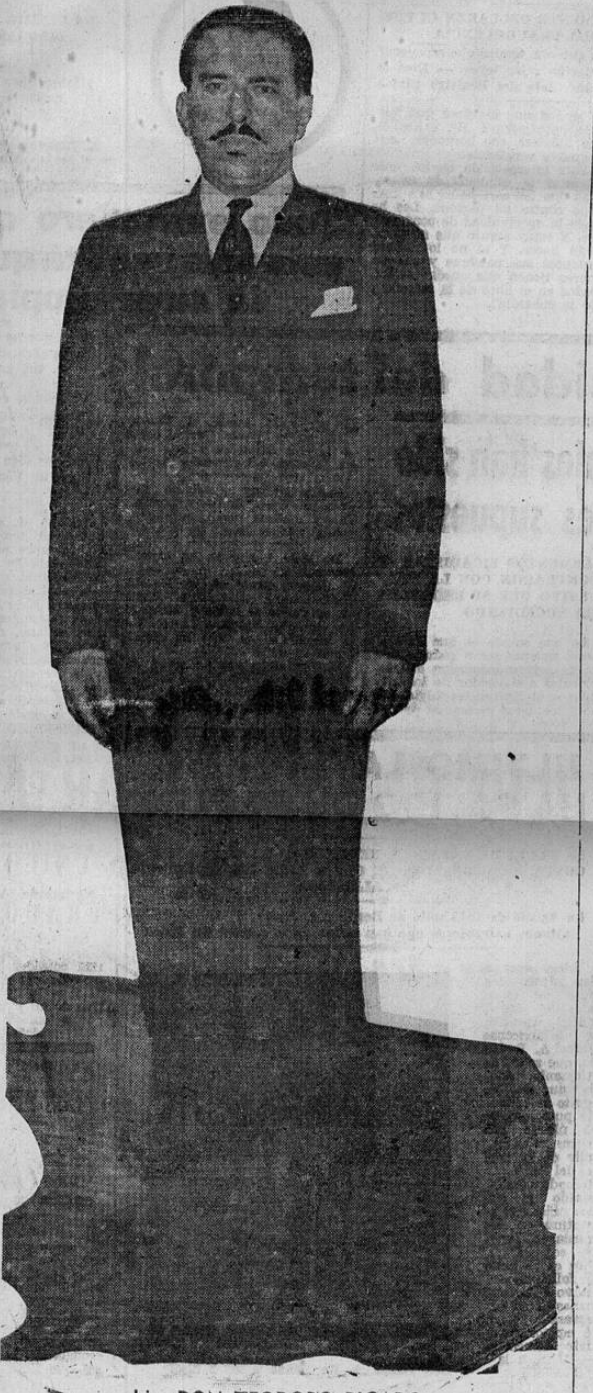
Lic. DON TEODORO PICADO

EL MENSAJE DE ESTA NOCHE DEL PRESIDENTE ELECTO A COSTA RICA ENTERA TEODORO PICADO hablará HOY a las 6.30 desde LA VOZ DE LA VICTOR