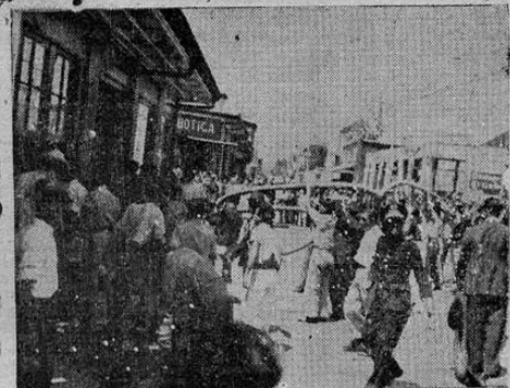
EL MOMENTO más agitado de la jornada de ayer: los bomberos se adelanzan como una heroica tromba contra el fuego de Paquetes Postales. (Fotos de Castillito para ULTIMA HORA).

LAS PERDIDAS EN MERCADERIAS, IMPUESTOS DE ADUANA, EDIFICIO, ETC., PASAN DE LOS SEIS MILONES DE COLONES SE CONFIRMA LA VERSION DE QUE EL FUEGO COMENZO SIMULTANEAMENTE POR VARIOS PUNTOS