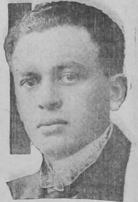
Dr. MORENO CAÑAS