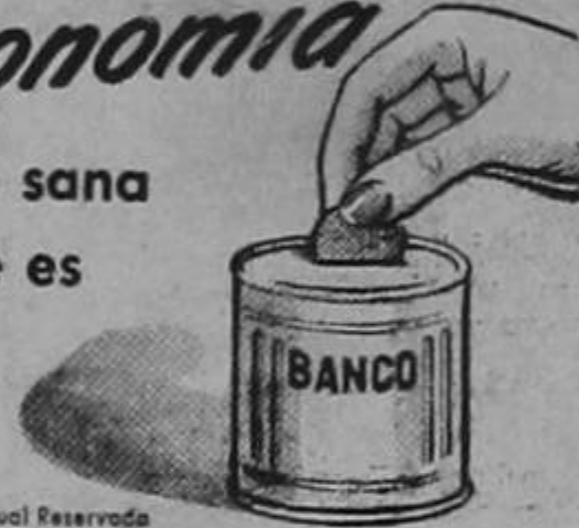
Coopr. Borden Co. Propiedad Intelectual Reservada