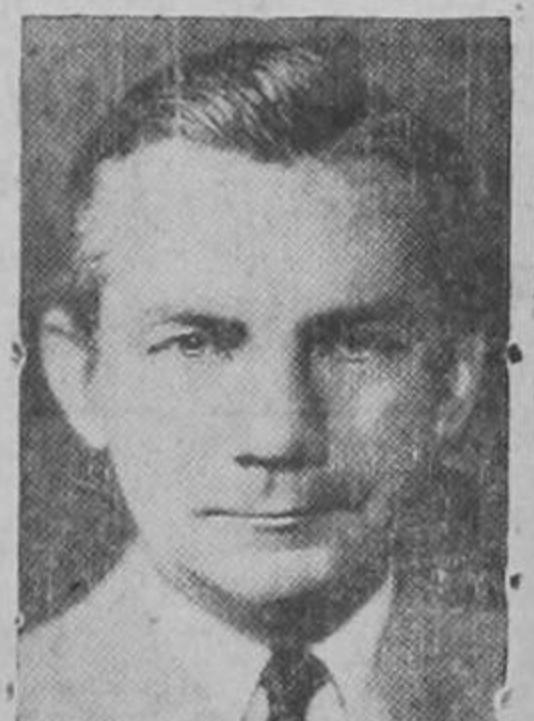
James V. Forrestal, secretario de Marina de los Estados Unidos, que decidió bautizar un barco de guerra con el nombre de "VICTORIA DE COSTA RICA"